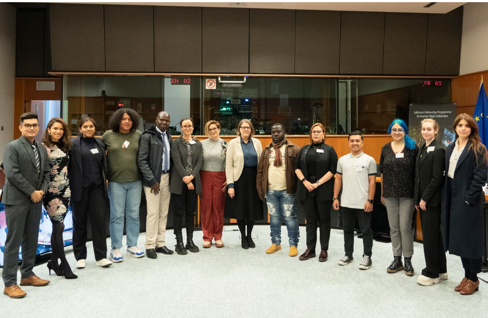
► PROGRAM STYPENDIALNY IM. SACHAROWA W 2024 R. Z UDZIAŁEM WICEPRZEWODNICZĄCEJ HEIDI HAUTALI

Za pośrednictwem programu „Trójkąt na rzecz demokracji” posłowie wspierają parlamenty partnerskie, skupiając prawodawców, społeczeństwo obywatelskie i podmioty medialne, aby zwalczać dezinformację i jednocześnie chronić wolność wypowiedzi.