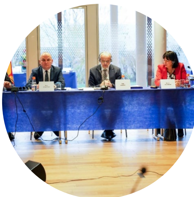
► DIALOG IM. JEANA MONNETA Z PARLAMENTEM MACEDONII PÓŁNOCNEJ

Posłowie do PE prowadzą mediację w Ukrainie, Serbii i Macedonii Północnej, przez co zapewniają wartość dodaną ogólnym wysiłkom UE na rzecz rozwiązywania konfliktów i dają jednocześnie Parlamentowi Europejskiemu dużą widoczność.