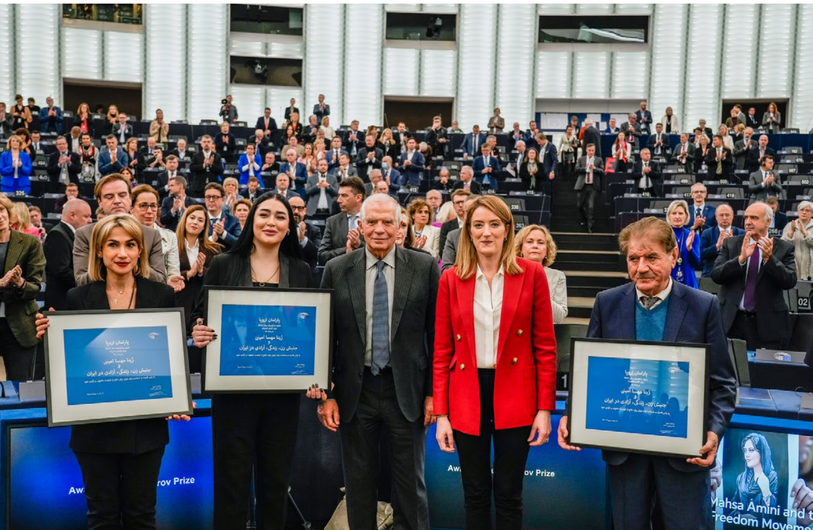
▶ PRZYZNANIE NAGRODY IM. SACHAROWA W 2023 R.